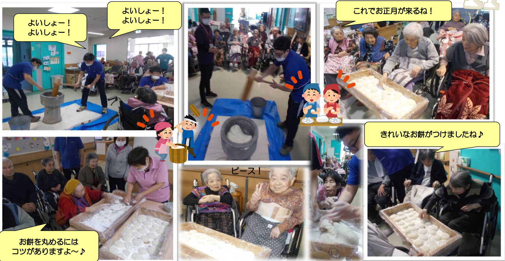
よいしょー！ よいしょー！

12月27日(金)は、2年ぶりに園内での「もちつき大会」を開催することができました。ここ数年は感染症拡大予防のために、もちつき大会の開催を控えていましたが、今年は入所者様の間でインフルエンザや新型コロナの感染が見られていないこともあり、開催を決定しました。もち米が蒸し上がる香りやもちつきのペタンペタンという音、もろぶたに並んだ丸もちなど、もちつき大会ならではの風景に入所者様も「良いおもちができたね」「これでお正月が来るね」「昔はこうやっておもちをついたものだよ」とたくさんのお話をしてくださり、入所者様、職員が一緒になって笑顔溢れる楽しい時間を過ごすことができました。